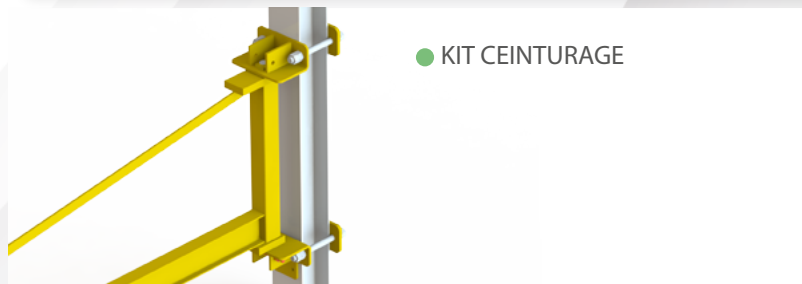
● KIT CEINTURAGE