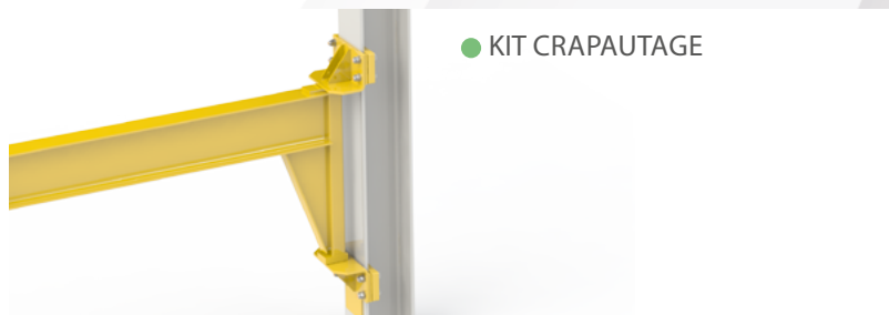
● KIT CRAPAUTAGE

- La vérification de la tenue du poteau, en fonction des réactions T1, T2 et V figurant sur les tableaux techniques, est de la seule responsabilité du client.