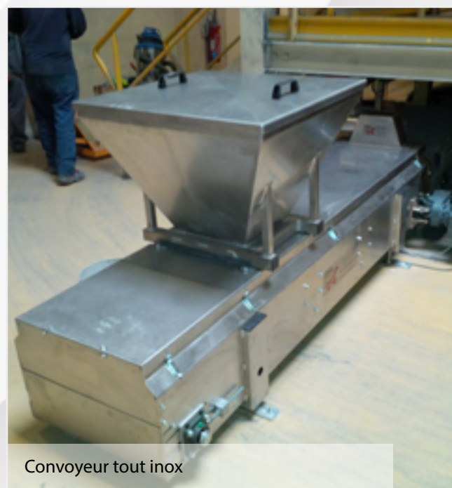
Convoyeur tout inox