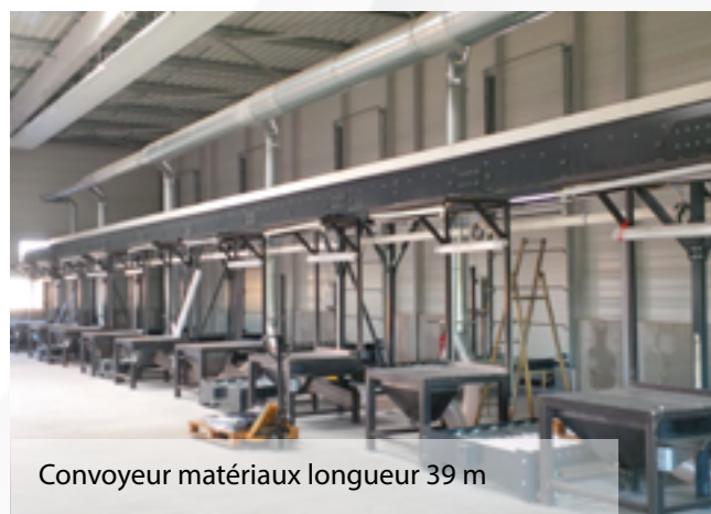
Convoyeur matériaux longueur 39 m