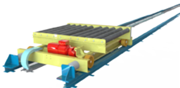
Navette à convoyeur à rouleaux embarqué